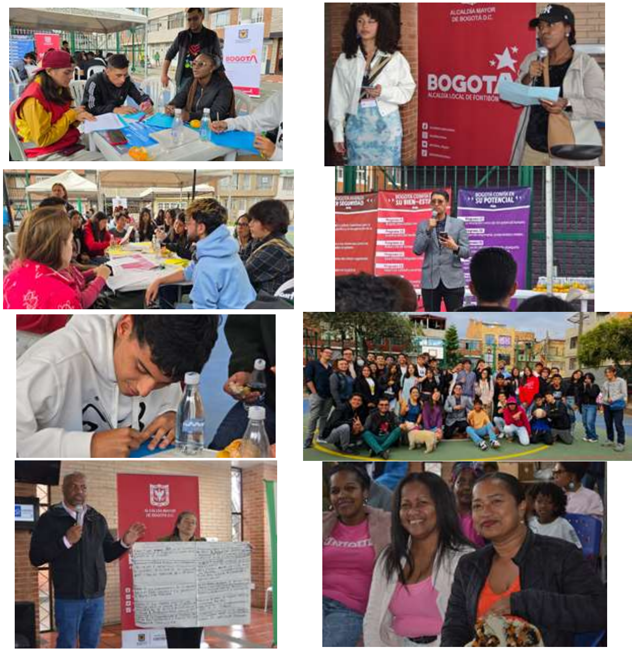
Gráfico 5. Ilustraciones de participación ciudadana en Fontibón