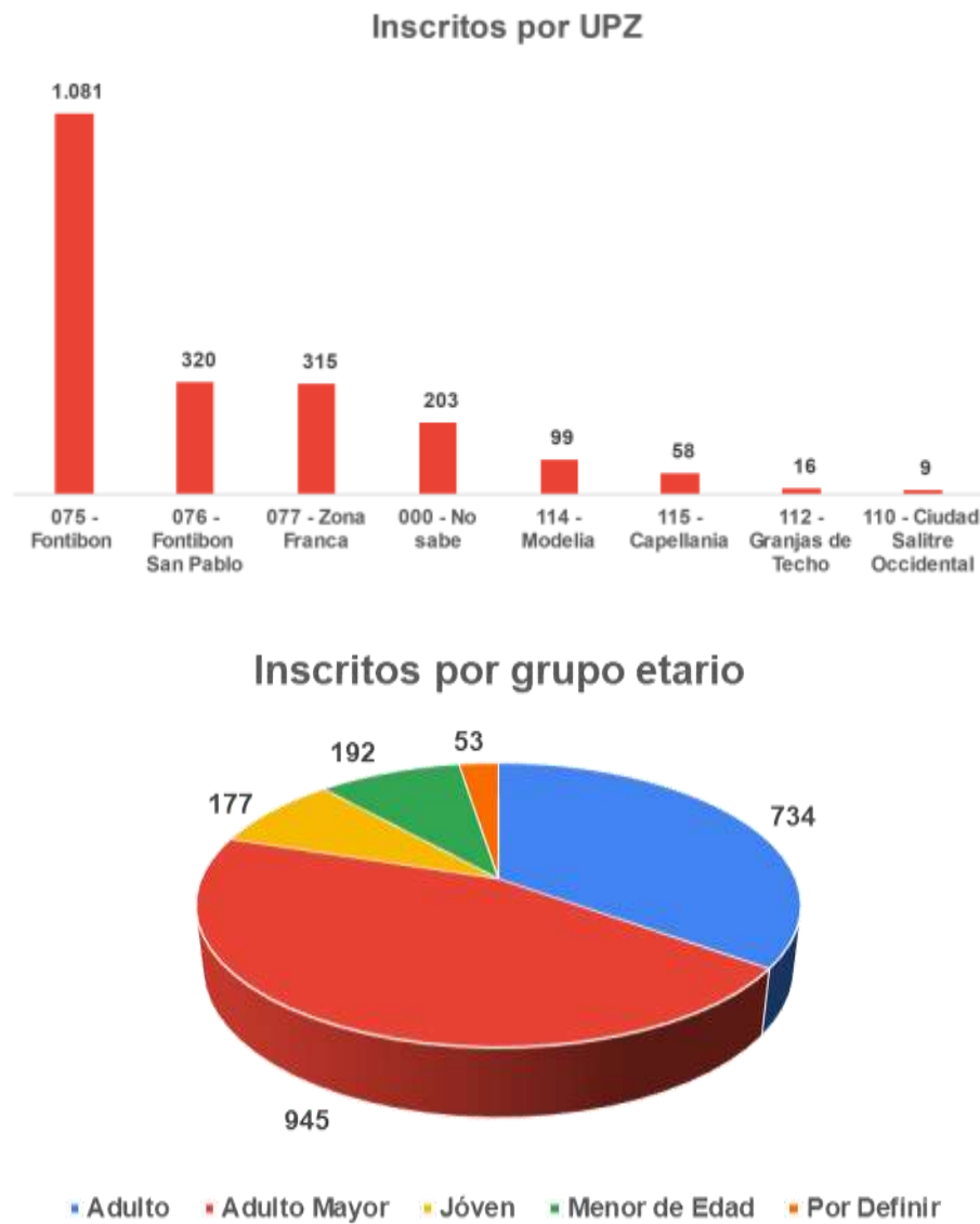
Gráfico 4. Inscritos Encuentros Ciudadanos Fontibón 2024

El análisis de datos relacionado a continuación corresponde a los datos de inscritos que corresponden efectivamente a la localidad de Fontibón.