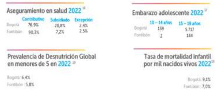
Gráfico 2. Salud en Fontibón 2022